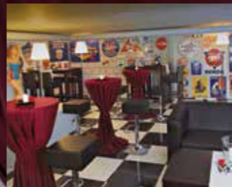
50's Lounge für bis zu 30 Personen