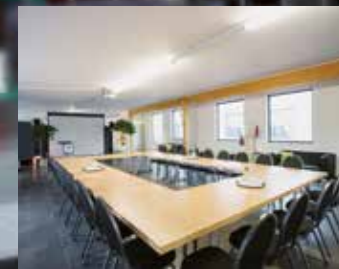
Penthouse für bis zu 150 Personen