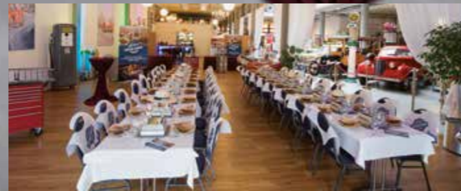
Forum für bis zu 200 Personen