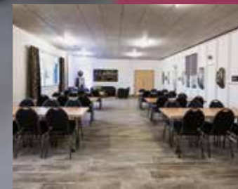
Loft für bis zu 50 Personen