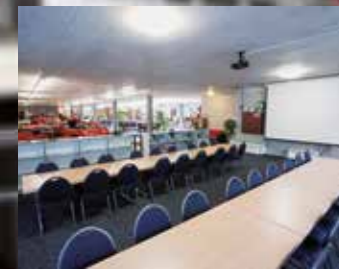
Cinema für bis zu 40 Personen

Für Ihr nächstes Seminar oder Kunden- bzw. Mitarbeiter-Event, für Geburtstag, Hochzeit, Familienfest oder andere Veranstaltungen haben wir die perfekte Location! Wir bieten Ihnen insgesamt 9 verschiedene Räumlichkeiten in einmaligem Ambiente zur Auswahl an, welche mit oder ohne unserem hauseigenen Catering gemietet werden können.